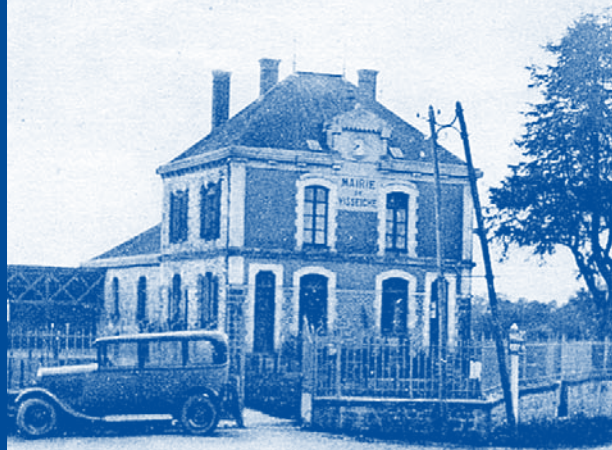
Visseiche (I & V) - La Mairie.