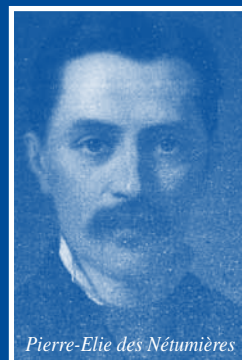
Pierre-Elie des Nétumières

C'est à la fin du 16 e siècle, que le château de la montagne devient propriété des Hays de Nétumières. En 1784, le château est abandonné au profit du château voisin de Montbuan. Et c'est à partir de 1880, sur l'initiative du comte Pierre-Elie